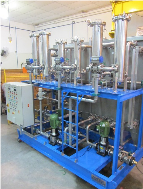
CENTRAL DE FLUÍDO