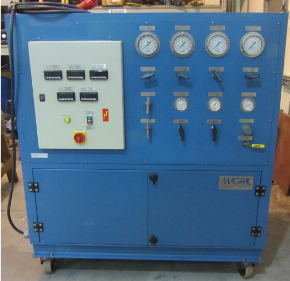
UNIDADE DE FLUSHING